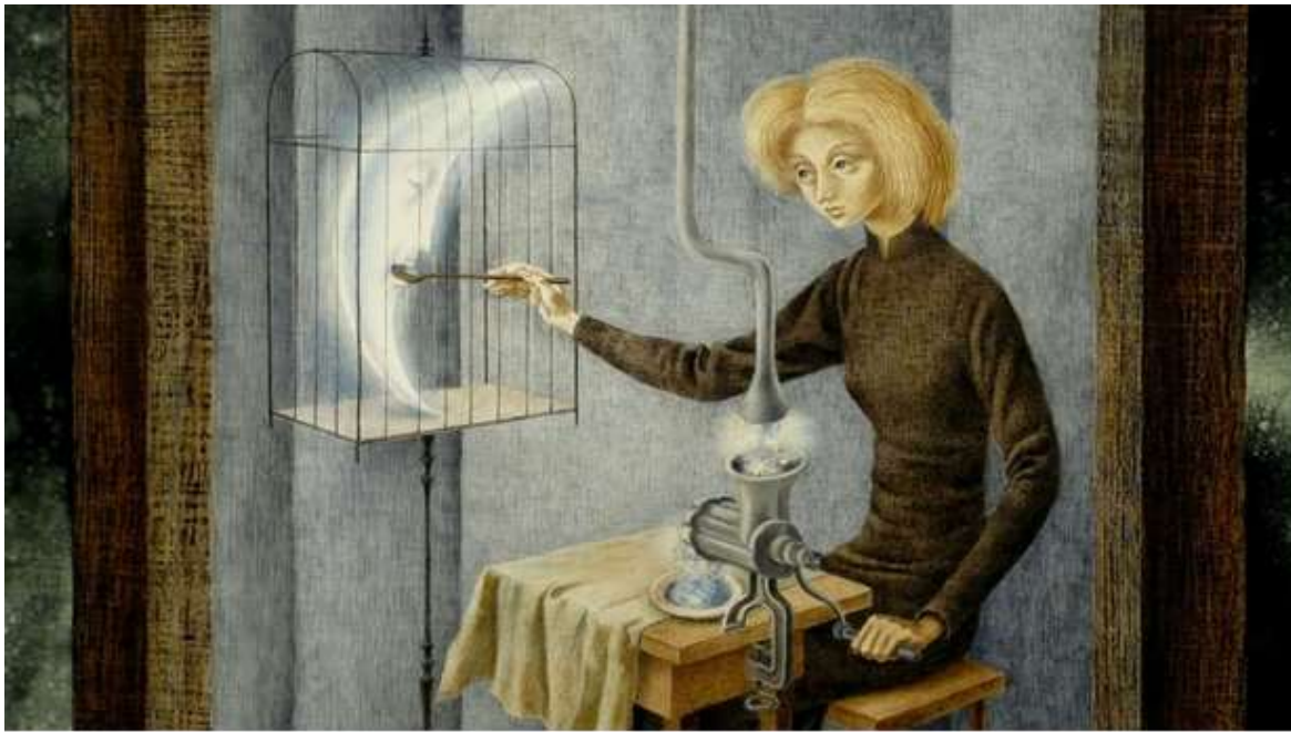
2. Remedios Varo