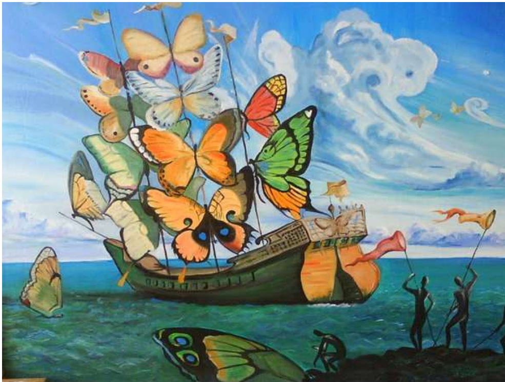
3. Salvador Dalí