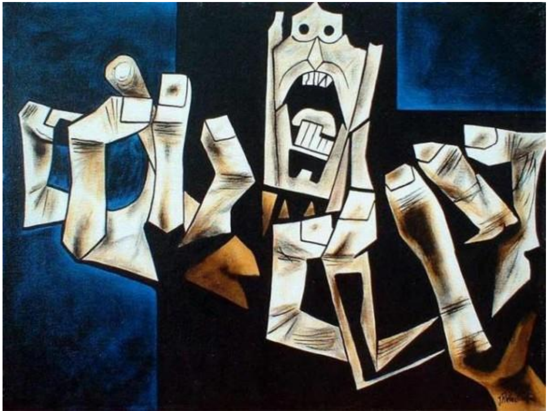
Las manos de la protesta, de Oswaldo Guayasamín

Algunas corrientes que optan por la imagen figurativa no realista pueden ser la caricatura, el expresionismo y el idealismo.