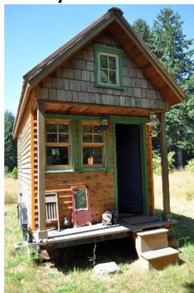
My little house.

PARTE 4. Lea el texto y conteste las preguntas de la en su hoja de respuesta.